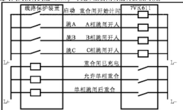
图1 以单跳跳闸命令实现单相重合闸模式的7VK611装置与外部保护联系图

为了防止上述信号瞬时中断,导致重合闸放电,7VK611 装置会检测开关“>CB1 ready”信号恢复的时间“T-CB TIME OUT”,如果开关在恢复时间内没有到达“ready”状态,重合闸功能将会被闭锁。